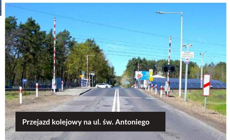
Przejazd kolejowy na ul. św. Antoniego

W sumie na odcinku Będzin – Zawiercie powstanie 16 zupełnie nowych obiektów – wiaduktów i przejść pod torami. Poza wymienionymi, przejazdy w poziomie szyn zostaną zlikwidowane m.in. przy przystanku Będzin Ksawera.