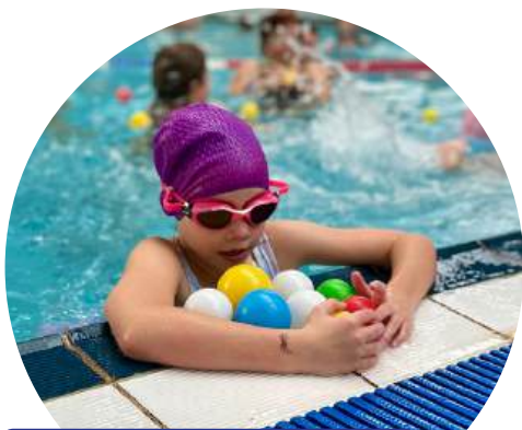
NIEDZIELNE ANIMACJE NA BASENIE