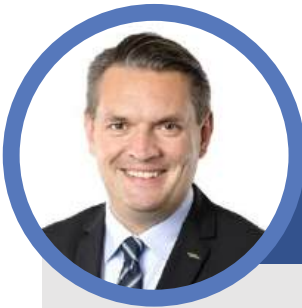
MARCIN BAZYLAK prezydent Dąbrowy Górniczej