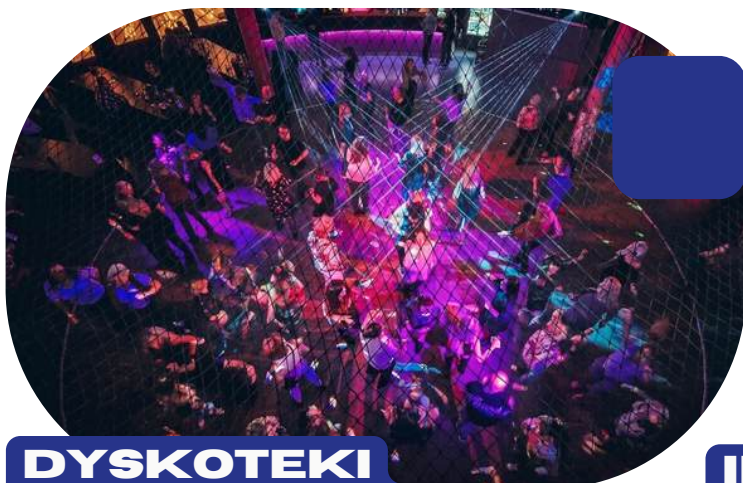
DYSKOTEKI W KLUBIE AQUARIUM