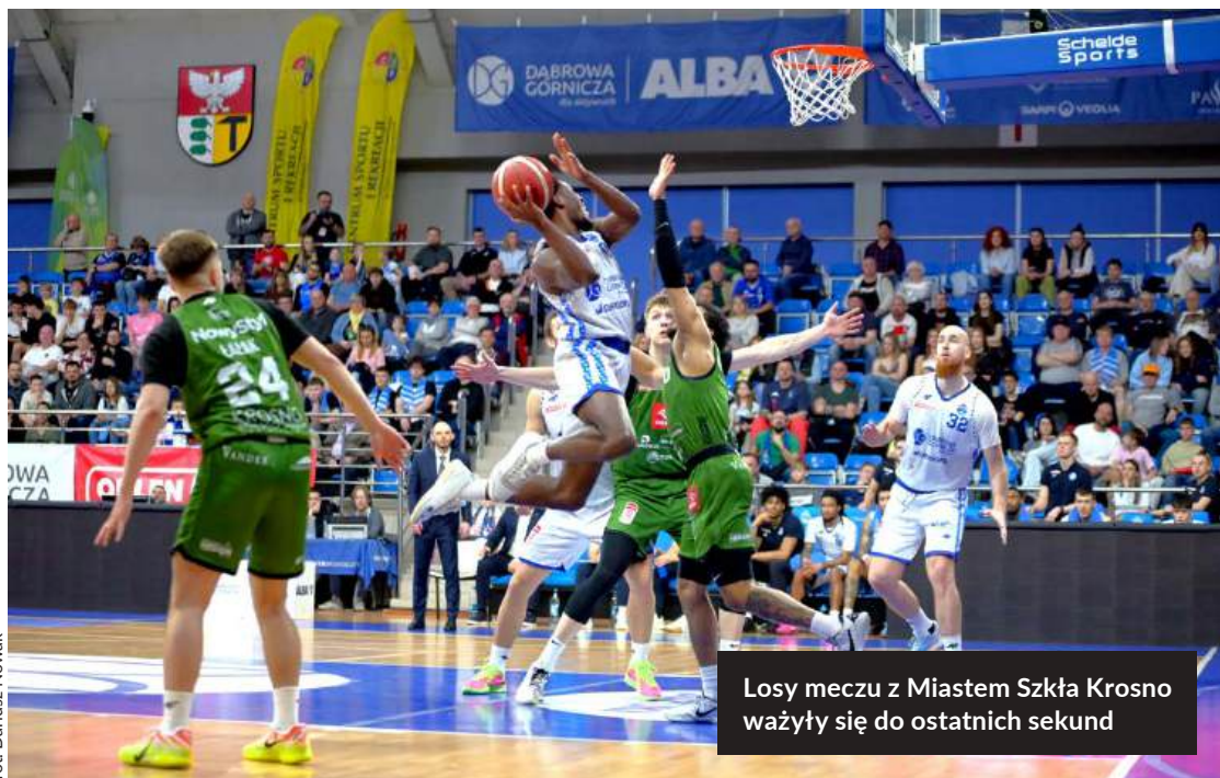
Losy meczu z Miastem Szkła Krosno ważyły się do ostatnich sekund

Przed Dąbrowianami decydujące mecze, które dadzą odpowiedź na pytanie o miejsce w play-offach. Przed nimi wyjazd do lidera w Szczecinie (25 kwietnia) oraz niezwykle ważne, domowe starcie z Legią Warszawa (1 maja). Przy wsparciu „szóstego zawodnika”, jakim są dąbrowscy kibice, MKS jest w stanie sprawić niespodziankę i udowodnić, że staje się stałym elementem ligowej czołówki. Zapraszamy do Hali Widowiskowo-Sportowej „Centrum” im. Zygmunta Cybulskiego, aby osobiście doświadczyć emocji podczas meczu.