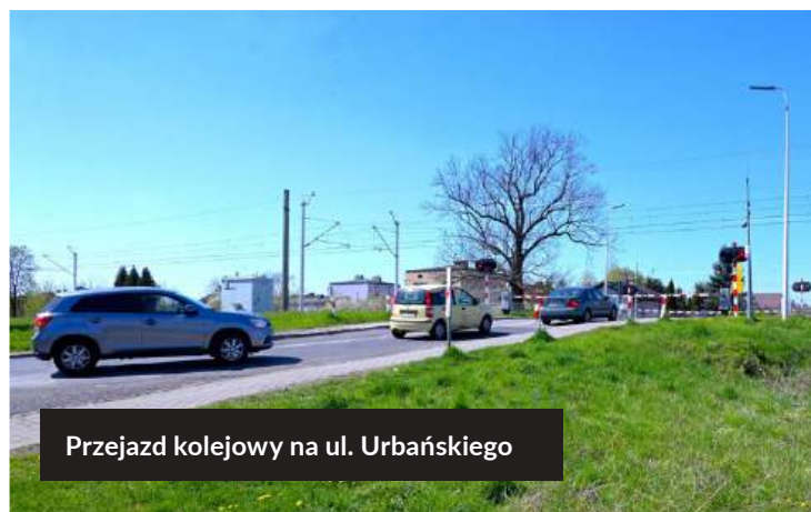
Przejazd kolejowy na ul. Urbańskiego

a Zawierciem o ok. 5 minut. Dostępność do kolei aglomeracyjnej ma zwiększyć nowy przystanek Dąbrowa Górnicza Zagłębie (nazwa robocza), który powstanie między stacjami