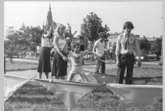
Dni Dąbrowy - czerwiec 1979