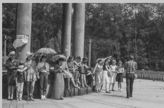
Zuchowa majówka - Zielona - maj 1984