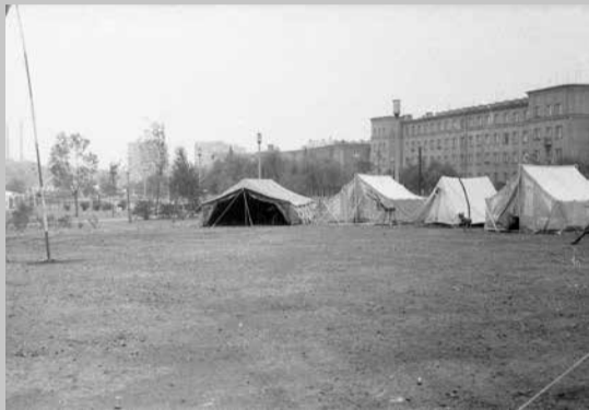
Dni Dąbrowy - biwak 1975

Lato w mieście nie musi być nudne. Wiemy to od dawna, o czym świadczą zdjęcia z lat 70. i 80. XX wieku z archiwum Hufca ZHP w Dąbrowie Górniczej. A jakie są Państwa wakacyjne wspomnienia z tamtych czasów?