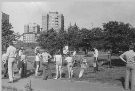
Dni Dąbrowy - czerwiec 1979