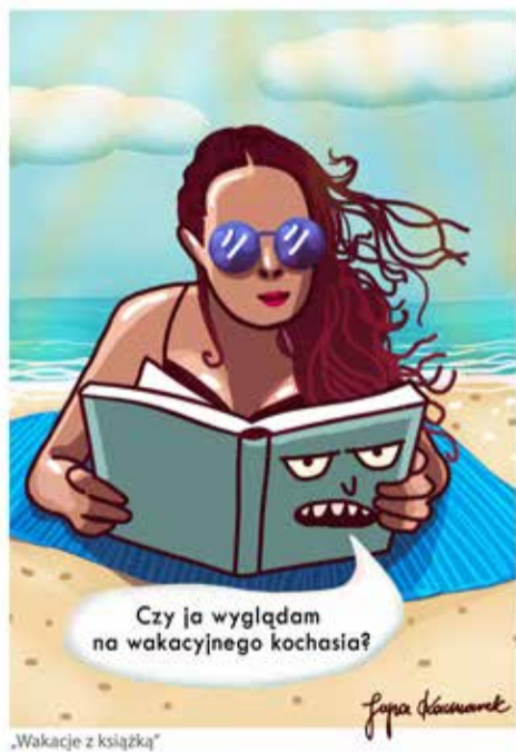
„Wakacje z książką”

Biblioteka postanowiła świętować Dzień Dziecka w sposób najbardziej bezpieczny z możliwych, a więc w przestrzeni wirtualnej. Przez cały dzień na Facebooku MBP nie można było się nudzić! O poranku odbyło się spotkanie z Panem Pedro i jego niezwykłym cyrkiem, który z pewnością rozbawił nie tylko tych najmłodszych, ale i nieco starszych. Trochę później wszyscy mieli okazję poznać najmłodszą latorośl Hugonowej rodziny, aby po południu zasiąść wygodnie przed monitorami i obejrzeć wyjątkowy spektakl Teatru Gry i Ludzie – „Dobry las”. Zwieńczeniem świątecznego dnia był specjalny odcinek „Biblioteka czyta dzieciom”, w którym najmłodszy mogli posłuchać bajki o Zającu Grajku. Pozytywny odbiór wszystkich przedsięwzięć nie zmienia jednak faktu, iż wszyscy żywią nadzieję na spędzenie tego wyjątkowego dnia w murach bibliotecznych placówek już w przyszłym roku./MB/