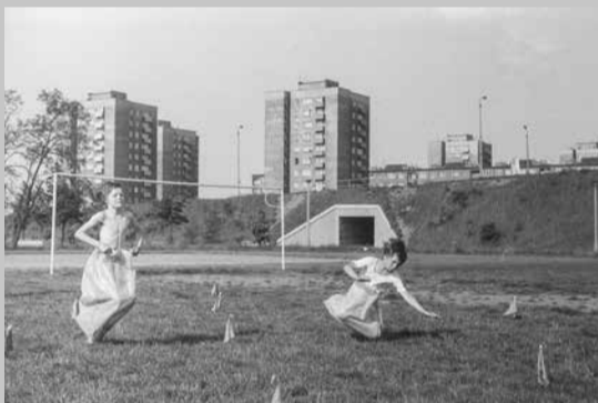
Dni Dąbrowy - czerwiec 1979