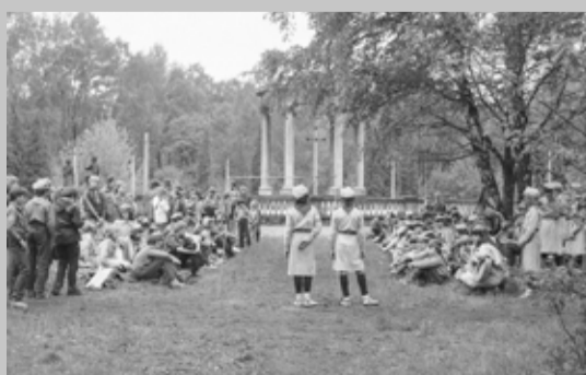
Zuchowa majówka - Zielona - maj 1987