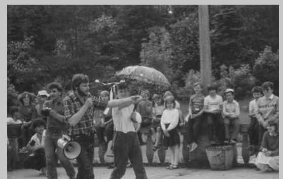
Zuchowa majówka - Zielona - maj 1984