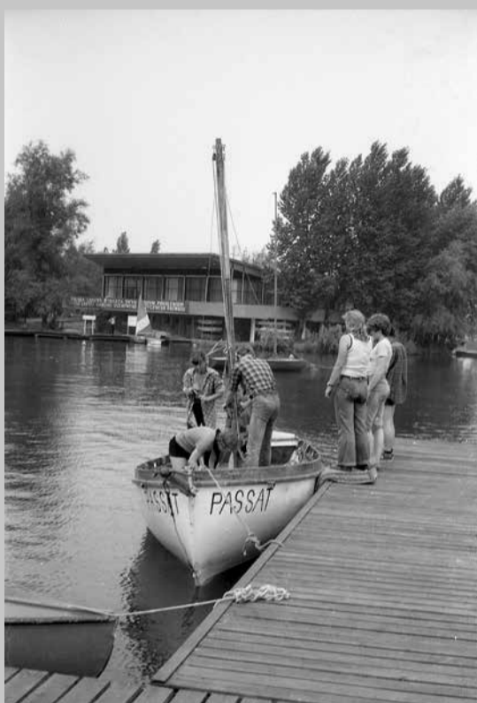
Obóz wodny Pogoria 3 - lata 80.