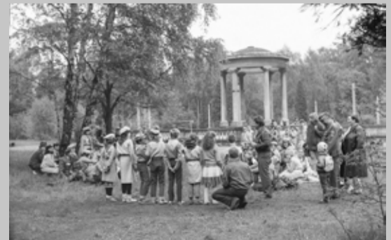
Zuchowa majówka - Zielona - maj 1987