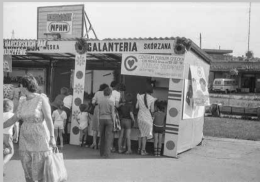
Dni Dąbrowy - czerwiec 1979