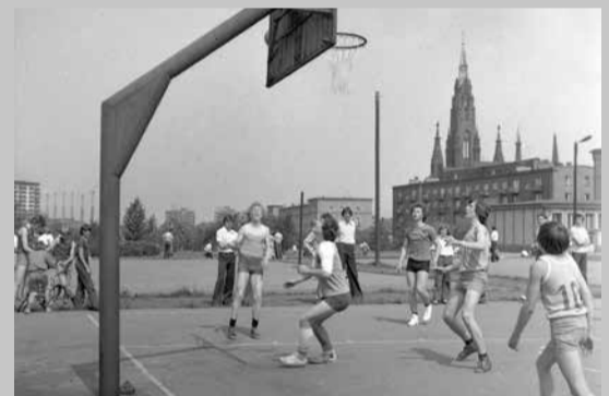
Harcerska olimpiada - 4 VI 78